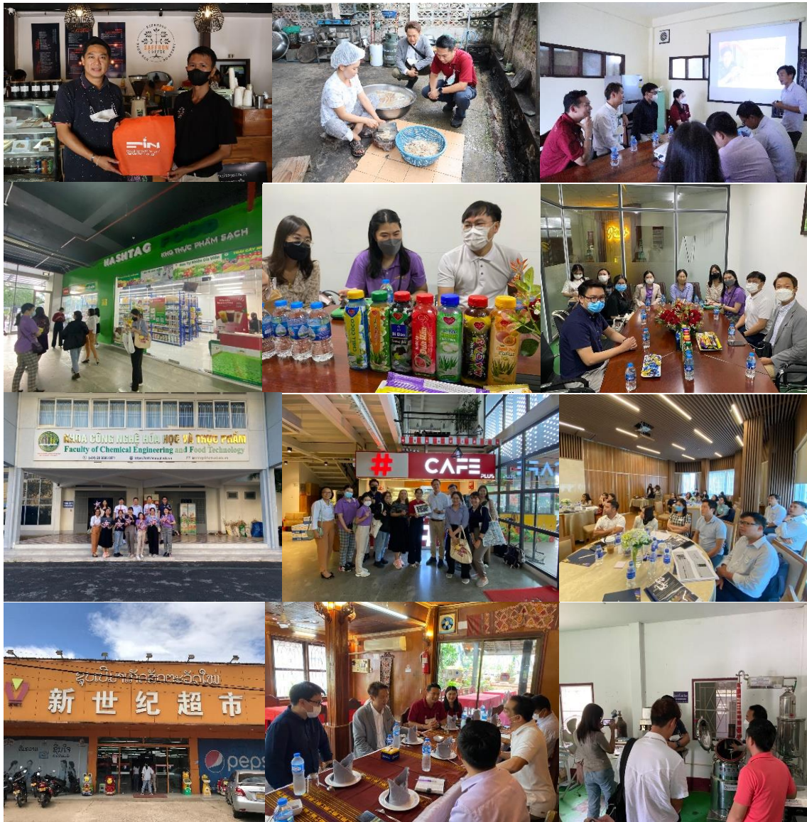
ภาพการดำเนินงาน