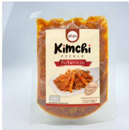
ภาพตัวอย่างผลิตภัณฑ์

ลิงค์สนับสนุนโครงการ: https://cbec.icdi.cmu.ac.th/Home.aspx